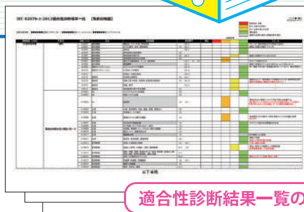
適合性診断結果一覧の一例

ダイテックのマニュアル診断サービスは、読みやすさ・使いやすさに配慮した改善提案(構成・記載項目、検索性、文章見直し、イラスト表現等)のみならず、安全法規への適合や警告ラベルなどの不備(欠陥)について総合的に診断の上、必要な対策も提案します。